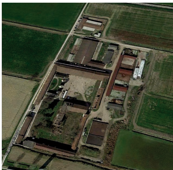
Figura 5. Vista aerea delle strutture di allevamento (azienda Porcellasco) .