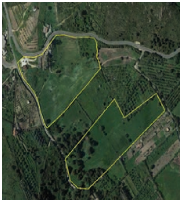
Figura 6. Mappa dell'azienda Arbus.