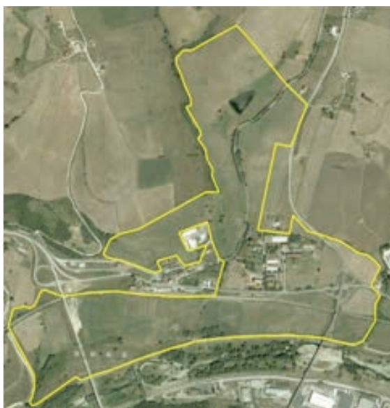
Figura 7. Mappa dell'azienda Bella.