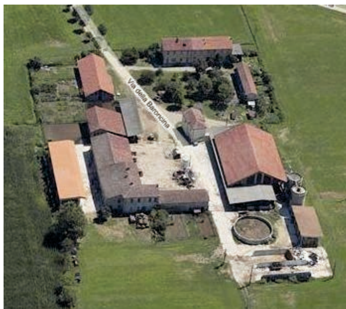
Figura 3. Vista aerea delle strutture di allevamento (Cascina Baroncina).