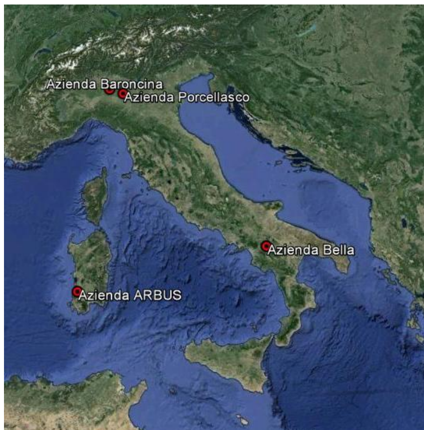
Figura 1. Localizzazione aziende di monitoraggio.

Il monitoraggio è stato effettuato presso due allevamenti bovini, un allevamento ovino ed un allevamento ovino-caprino (Figura 1).