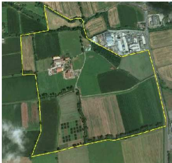
Figura 2. Mappa della Cascina Baroncina.

Anche nel 2013, l'azienda si è classificata al primo posto per produzione media per vacca (13.030 kg di latte, 432 kg di proteina) nell'ambito degli allevamenti delle province di Milano e Lodi.