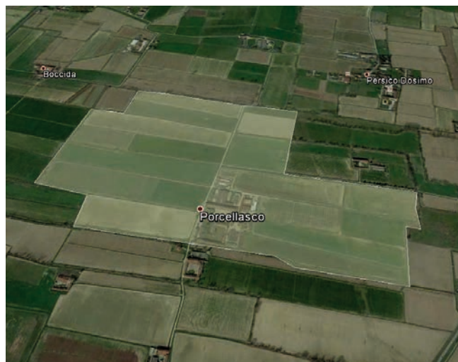
Figura 4. Mappa dell'azienda Porcellasco.

L'azienda Porcellasco (Figure 4 e 5), di proprietà del CRA, è situata nel comune di Cremona a circa 6 km dal centro cittadino (45°10'N, 10°04'E) e si estende per 82 ettari. Il terreno, pianeggiante, è di medio impasto e molto fertile. L'attività prevalente è l'allevamento bovino per la produzione di latte. Le colture principali sono erba medica e mais da utilizzare come fieno ed insilato; l'allevamento produce, mediamente, circa 630.000 kg di latte l'anno; mediamente, ogni anno, vengono allevate 80 vacche e 75 animali da rimonta; il numero di vacche mediamente in produzione è vicino alla media nazionale ma inferiore alla media regionale e provinciale degli allevamenti di Frisona Italiana controllati. La produzione media di latte è stata nel 2013 di 8725 kg/vacca, leggermente inferiore alla produzione media rilevata per le vacche di razza frisona Italiana controllate nella provincia di Cremona.